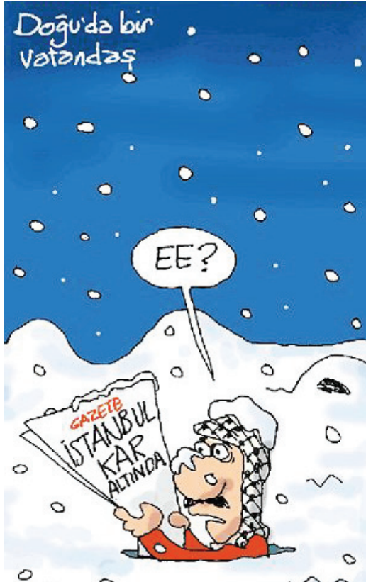
Bir karikatür, 13.02.2004.